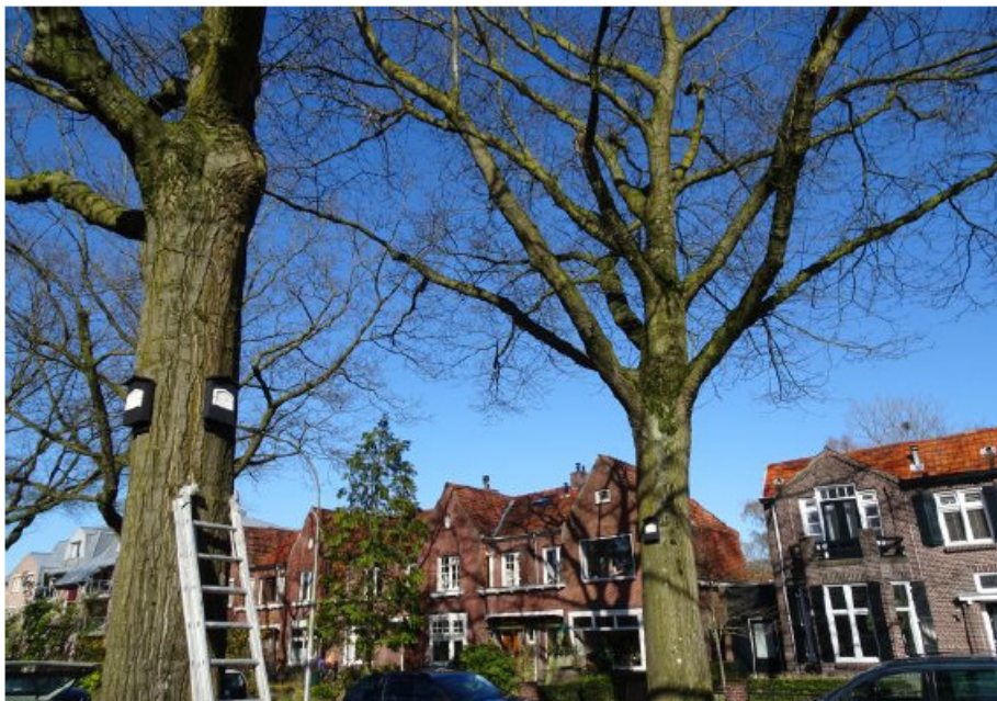
Figuur 2. Vleermuiskasten zoals die aan de bomen op de Hazekampseweg zijn opgehangen.