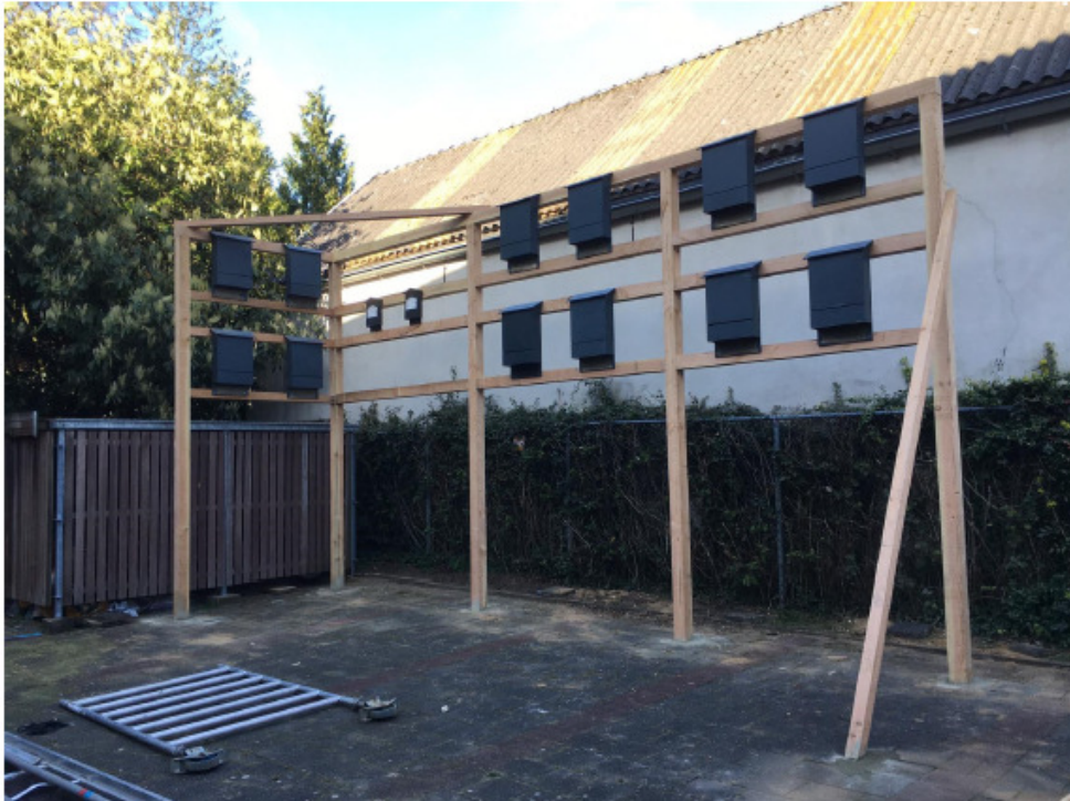
Figuur 3. De stallage zoals die is geplaatst op de locatie blauw in figuur 1.